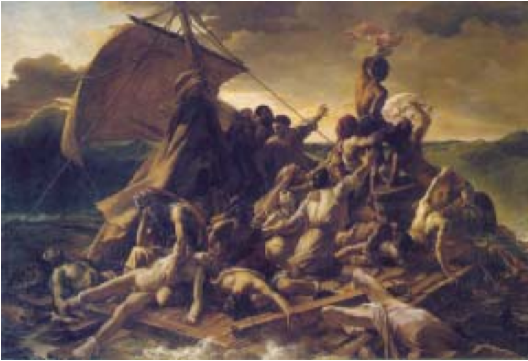
La balsa de la Medusa, del artista romántico francés Géricault